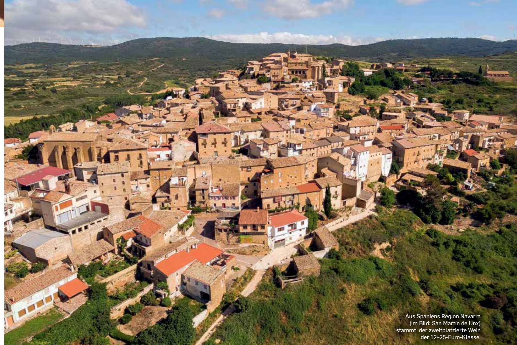
Aus Spaniens Region Navarra (im Bild: San Martín de Unx) stammt der zweitplatzierte Wein der 12-25-Euro-Klasse.

● 2017 VIGNE VECCHIE SOAVE DOC, TENUTA SANT' ANTONIO, COLOGNOLA AI COLLI (I) Strahlendes, helles Strohgelb. Nach Feuerstein, Limetten und Minze. Am Gaumen sehr saftig und klar, druckvoll, salzig, spannt einen weiten Fächer, mineralisch und präzise. tenutasantantonio.it, € 11,70