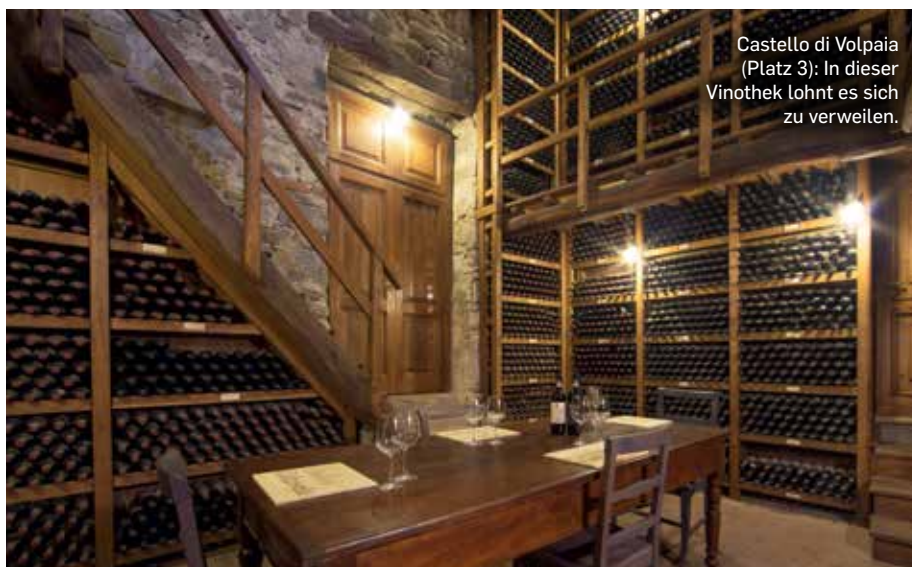
Castello di Volpaia (Platz 3): In dieser Vintothek lohnt es sich zu verweilen.

● 2019 RIESLING KREMSTAL DAC RIED MOOSBRUGGERIN, BUCHEGGER, DROSS (A) Zarte Zitrusnuancen unterlegen weißes Steinobst, feine Kräuternoten, ein Hauch von Ananas. Saftig, elegant, eingebundene Säurestruktur, straff, feine Pfirsichnoten, lang anhaltend, gutes Potenzial. buechegger.at , € 21,-