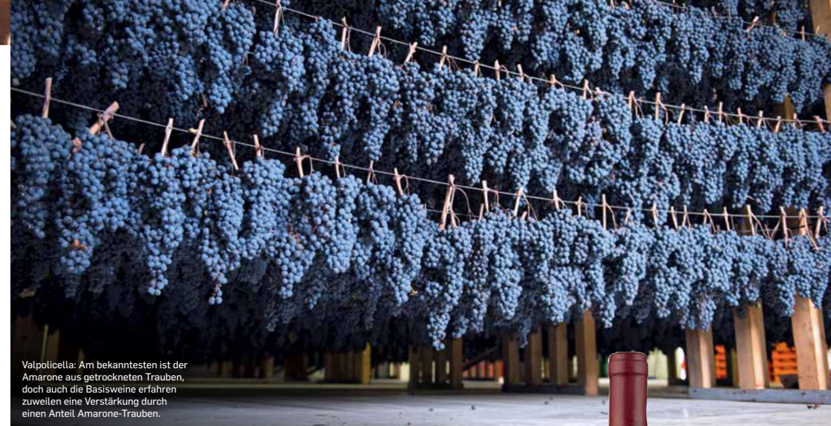
Valpolicella: Am bekanntesten ist der Amarone aus getrockneten Trauben, doch auch die Basisweine erfahren zuweilen eine Verstärkung durch einen Anteil Amarone-Trauben.

● 2019 RIED HEILIGENSTEIN BERGJUWEL RIESLING, RETZL, ZÖBING (A) Mit Orangenzesten unterlegte gelbe Tropenfruchtanklänge. Reife Ananas, Mango klingt an, zarter Blütenhonig. Saftig, dezente Fruchtsüße, angenehmer Säurebogen, mineralisch, salziger Nachhall. retzl.cc , € 9,90