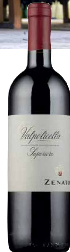
Ein Klassiker Norditaliens: der Valpolicella des Weinguts Zenato.

● 2018 NERÈ NERO D'AVOLA FEUDO MACCARI, NOTO (I) Duftig, nach roten Rosen, Himbeeren, Waldbeeren, leicht nach Hagebutten, einladend. Am Gaumen ausgewogen und harmonisch, spannt sich mit klarem, saftigem Kleid auf, fruchtiger Kern, leicht salziges Finish. feudomaccari.it , € 8,50 >