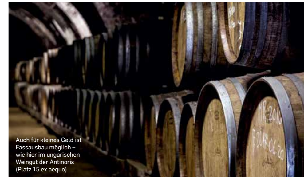
Auch für kleines Geld ist Fassausbau möglich – wie hier im ungarischen Weingut der Antinoris (Platz 15 ex aequo).