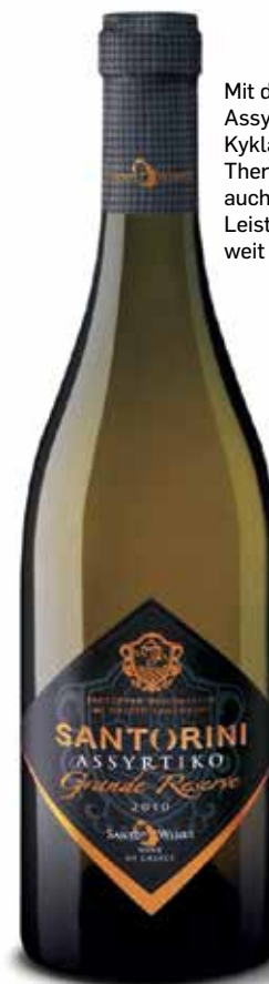
Mit der Rebsorte Assyrtiko ist die Kykladeninsel Thera (Santorin) auch beim PreisLeistungs-Aspekt weit vorne.

Minze und Eukalyptus, schwarze Waldbeeren, tabakig, Brombeerfrucht, Noten von Edelholz und Nougat. Stoffig, etwas dunkler Nougat, reife Kirschen, runde, tragende Tannine, verfügt über Kraft und Würze. vinorama.at , € 30,69