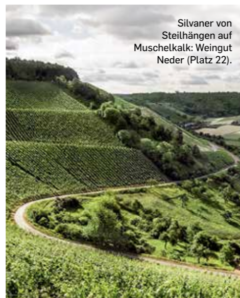
Silvaner von Steilhängen auf Muschelkalk: Weingut Neder (Platz 22).

● 2017 LA LOMA NAVARRA GARNACHA FINCA ALBRET, CADREITA (E) Herzkirsche, Minze, Himbeere und Kräuternoten. Am Gaumen fruchtgetragen und weit, aber auch mit feinem Gerbstoff und einer perfekt eingebundenen Säure strukturiert. belvini.de, € 8,90