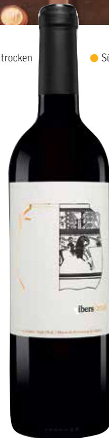
Platz 1 in der mittleren Preisklasse: Der »Ibers« vom Weingut Celler del Roure.

Biodynamisch. Würzig im Duft, butterart am Gaumen mit ultrafeinen Phenolen, die Säure ist nahtlos mit dem Körper verschmolzen, im Abgang blitzen beerige Sortenaromen auf. Die pure Delikatesse. weingut-leiner.de , € 15,-