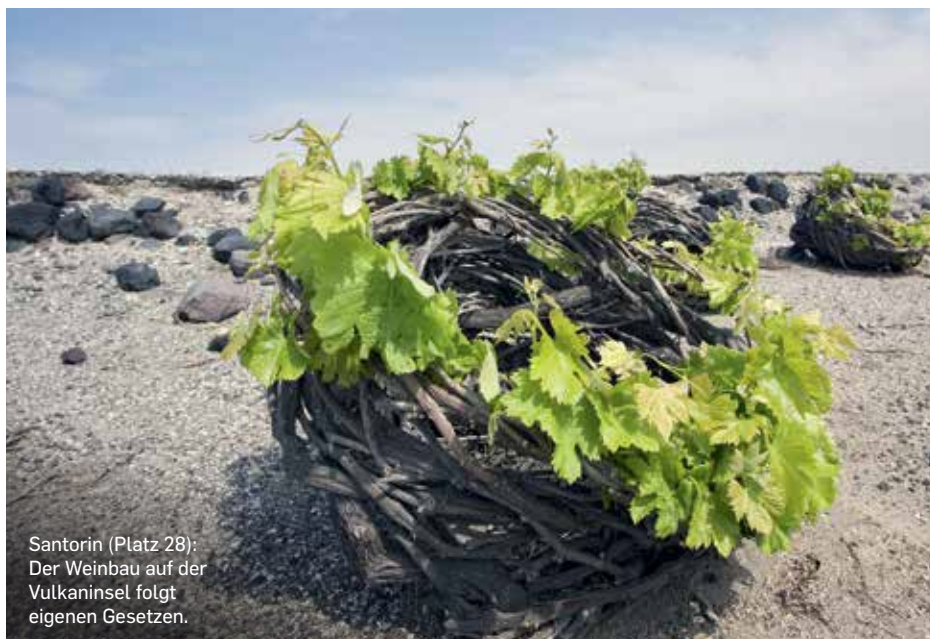
Santorin (Platz 28): Der Weinbau auf der Vulkaninsel folgt eigenen Gesetzen.

Honigmelone und Birnen, Limettenezesten, weiße Blüten, attraktives Bukett. Straff, elegant, weiße Frucht, ein Hauch von Marzipan, stoffige Textur, finsenreicher Säurebogen, deutliche Mineralität, Röstaromen im Abgang santorini.net , € 28,90